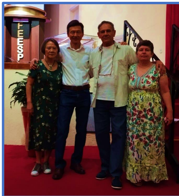
E dos anfitriões