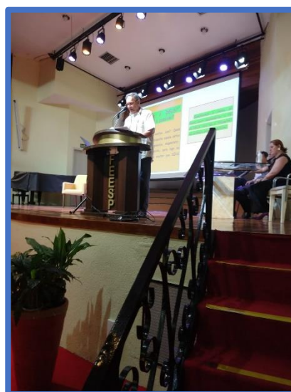
Desenvolvendo o tema