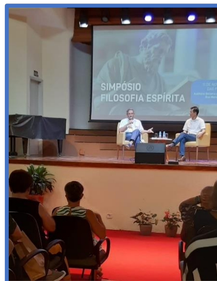
Pinga-fogo: DEUS, o primeiro motor não movido: do aristotélico ou do aquinate cristão?