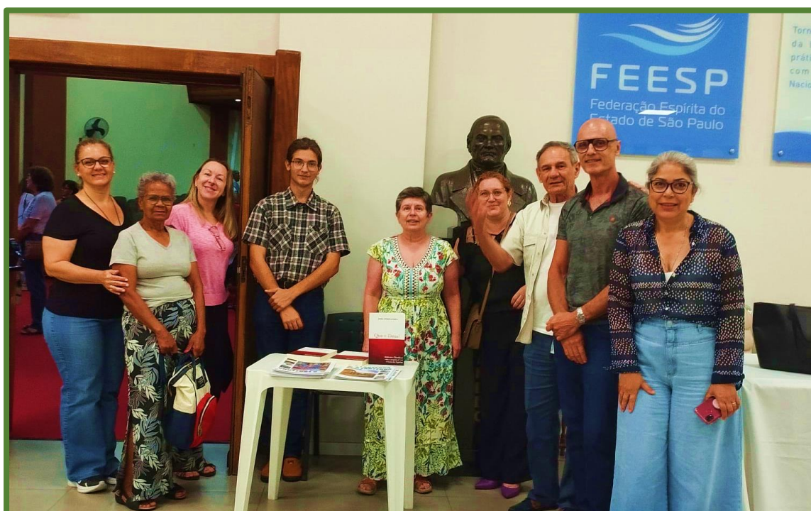
Nós, os do CENSN